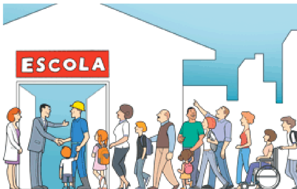
Figura 4: Escola um ambiente para todos