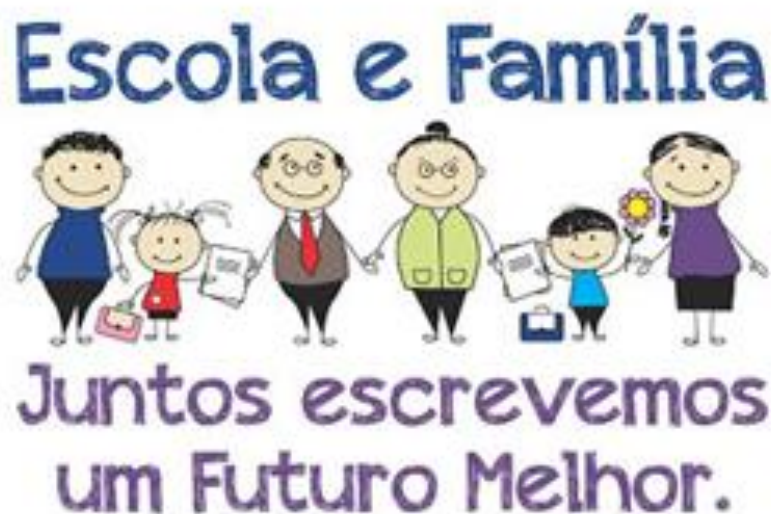
Figura 2: Escola e Família andam juntas