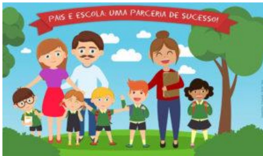
Figura 1: Parceria escola e família

Fonte: https://www.empresayes.com.br/blog/a-importancia-dos-pais-na-vida-escolar-dos-filhos/ . Acesso em: 29/05/2020