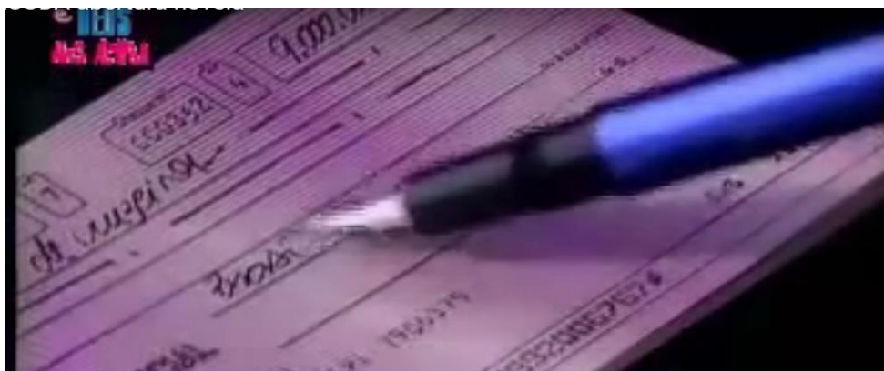
FIGURA 1: Início da abertura