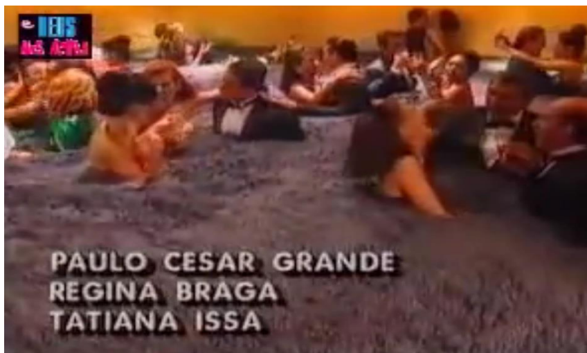
FIGURA 2: Pessoas se divertem em mar de lama